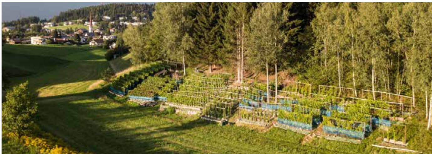
Der Viller Weinberg.

des Gsetzbichls, den mir Franz Wopfner ohne große Formalitäten zur Verfügung gestellt hat.